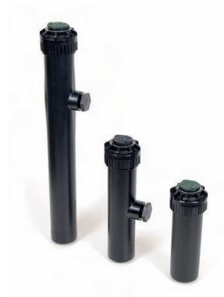
Model 5000 Plus

MPR (Matched Precipitation Rate) dizne s usklađenim intenzitetom pojednostavnjuju planiranje rasporeda rasprskivača jer omogućuju ugradnju rasprskivača različitog dometa i kuta navodnjavanja na istu liniju. Odgovaraju Rain Bird 5000/ 5000 Plus / 5000 Plus PRS rasprskivačima.